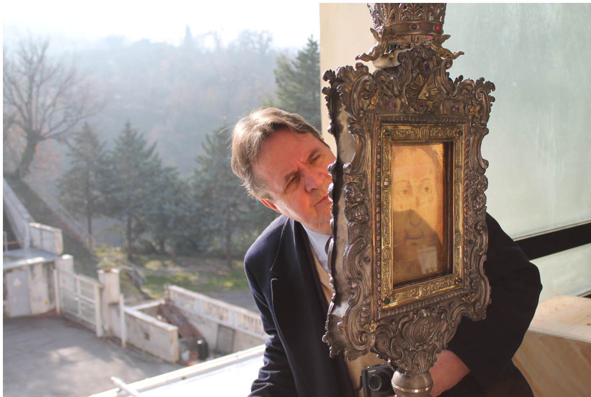
© Foto: Archiv von Herrn Badde (Nella luce del Suo Volto - Paul B by Alan H)

Herr Badde war als katholischer Journalist auch Buchautor und Filmemacher. Er verstarb am 10. November 2025 in Manoppello. Nicht nur alle, die das Glück hatten ihn persönlich gekannt zu haben, werden ihn schmerzlich vermissen. Auch von den Lesern seiner Bücher und von den Zuschauern seiner Filme, wird dieser tiefgläubige und stets freundliche Mensch, mit seiner herausragenden Fachkenntnis für religiöse Themen, sehr vermisst werden. Es wird wohl kaum jemanden geben, der im Heiligen Land mehr Zeit am Grab von Jesus verbracht hatte, als er. Dort schlich er um die Heiligtümer, wie eine Katze, die einem um die Beine streicht, wie er es mir einmal schrieb. Mit seinem fundierten Fachwissen und seinem Herzblut für Jesus und die Gottesmutter Maria, war er zeitlebens ein leidenschaftlicher Verfechter der Echtheit der beiden Bildgeschenke aus dem Grab von Jesus, die in Turin und Manoppello aufbewahrt werden. Auch war er von der Echtheit des Gnadenbildes von Guadalupe überzeugt, das uns von der Gottesmutter Maria geschenkt wurde.